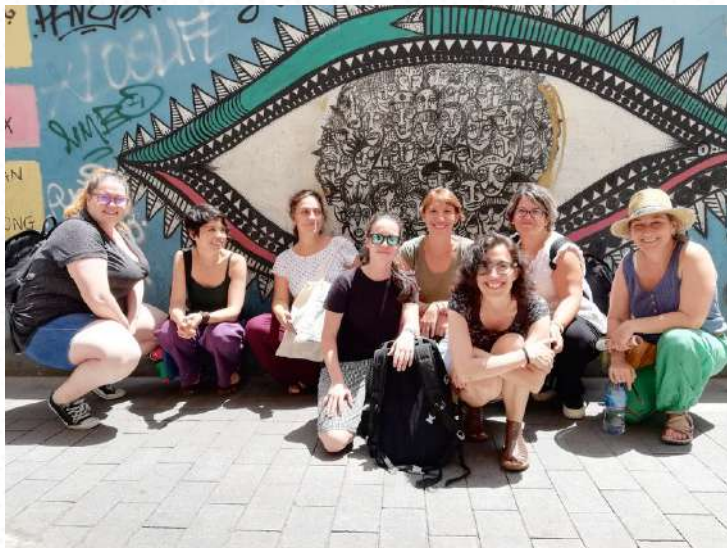
Memòria Migracions Coòpolis 2018-19 | MigrESS · IACTA · Diomcoop

Acció desenvolupada per sol·licitud d'un Certificat de Professionalitat del SOC al mòdul Anàlisi de l'entorn laboral i gestió de relacions laborals des de la perspectiva de gènere. Es van programar dues visites a experiències econòmiques de persones d'origen divers, i els vam presentar els seus processos. Aquestes experiències han sigut amb Mujeres Pa'lante i el Sindicat de Venedors Ambulants de Barcelona. Es va realitzar també una formació d'introducció als principis del cooperativisme i migracions.